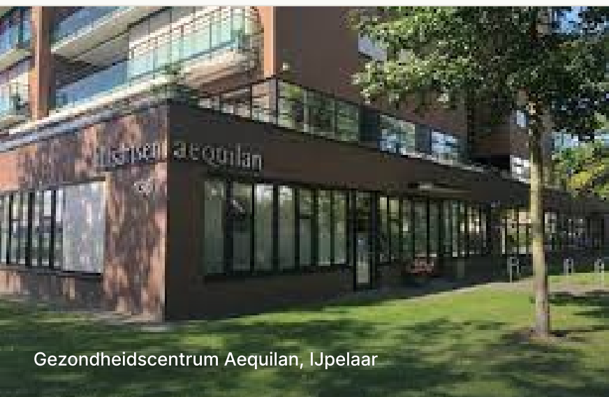
Gezondheidscentrum Aequilan, IJpelaar

Fijn dat u zich heeft ingeschreven bij onze praktijk. In deze folder vindt u alles wat u nodig heeft om uw weg bij ons te vinden — van afspraak maken tot herhaalrecepten, en alles daartussenin.